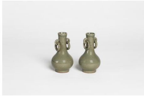
Ein Paar Henkelvasen

Longquan-Ware, Süd-China, Ming-Zeit, 15./16. Jh., hellgraues Steinzeug, olivgrüne Seladonglasur, H. jeweils 15,3 cm; Durchmesser jeweils 8,2 cm