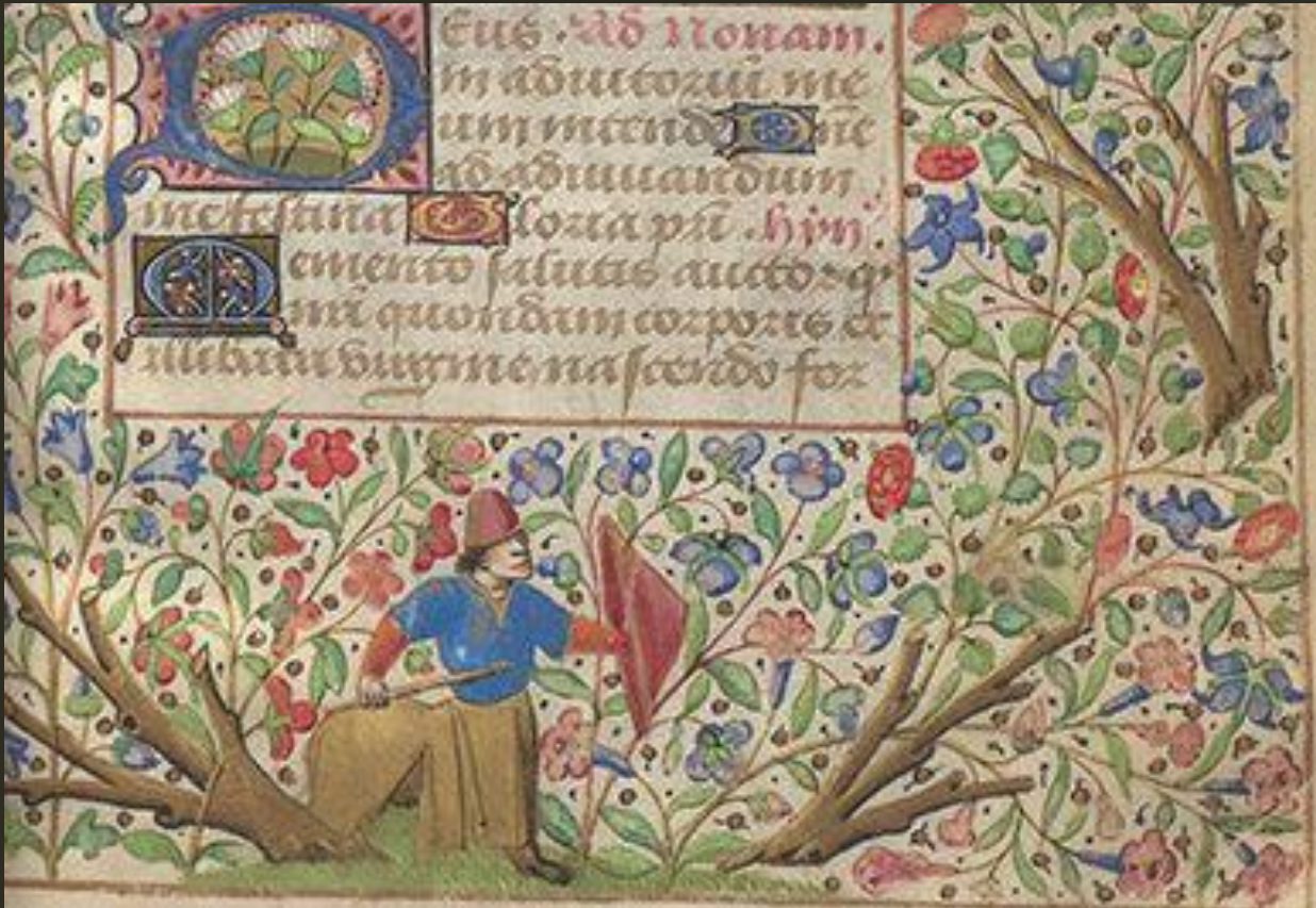
Abb.: LM 48, fol. 34, Detail