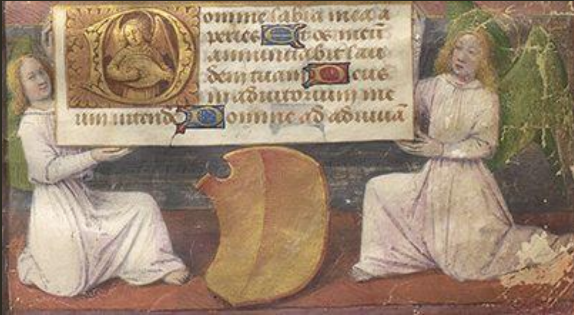
Abb.: LM 48, fol. 14, Detail