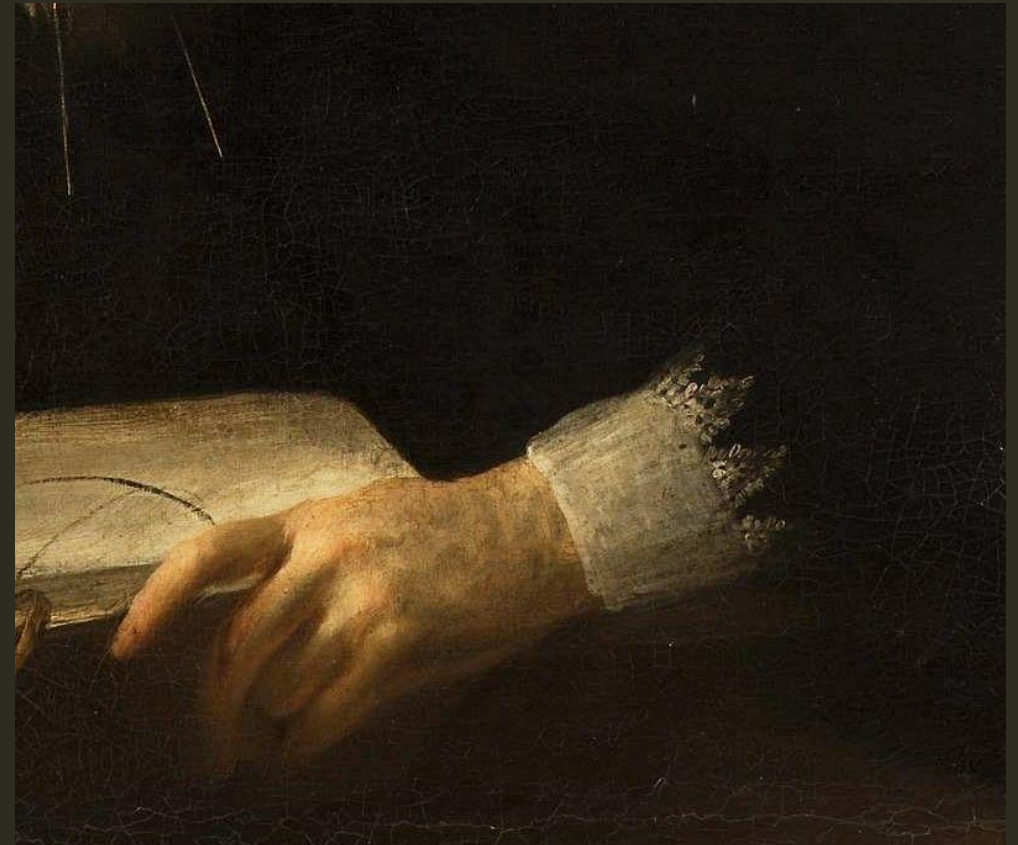
Abb.: Fläm. Anonymus: Porträt eines Astronomen (1. Hälfte 17. Jh.), Detail