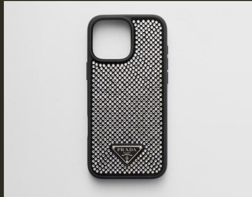
Abb.: Kristallbesetzte iPhone-16-Pro-Max-Hülle von Prada