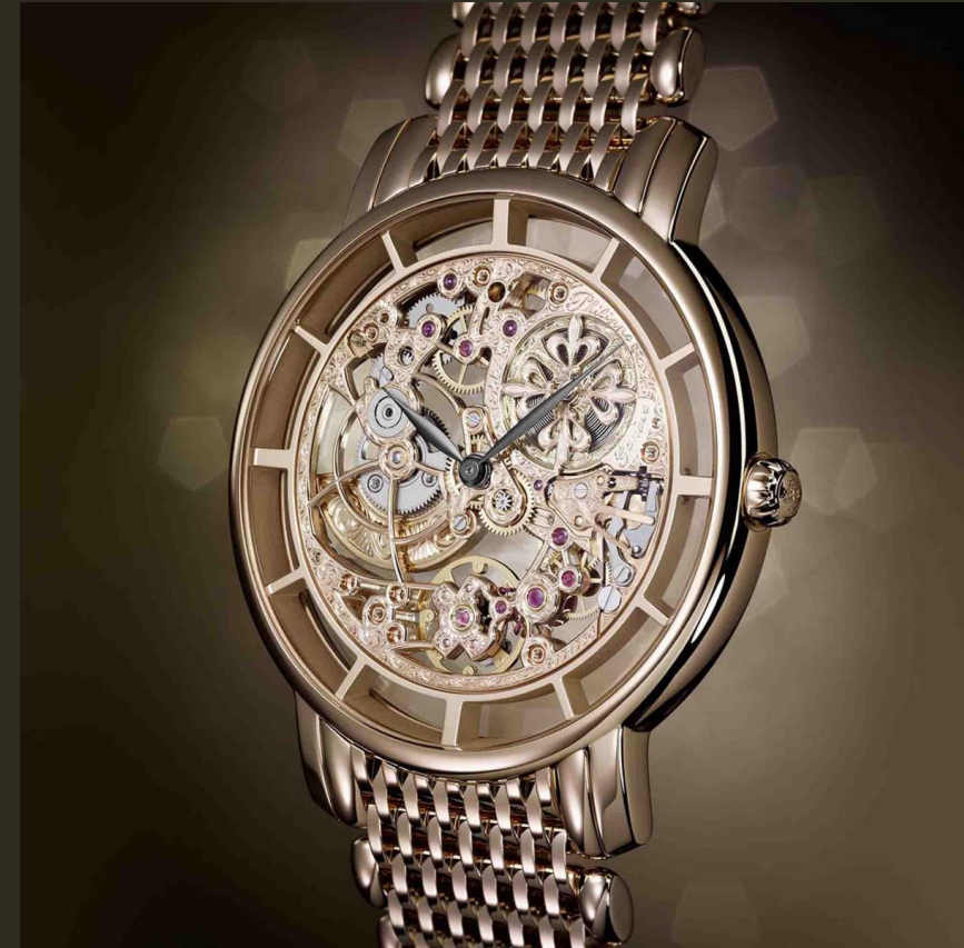
Abb.: Komplizierte Uhren 5180/1R-001 von Patek Philippe