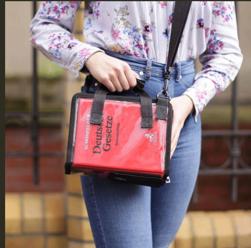
Abb.: Kompakte Tasche für Habersack, Schönfelder, Sartorius und Steuergesetze von Peercrimit