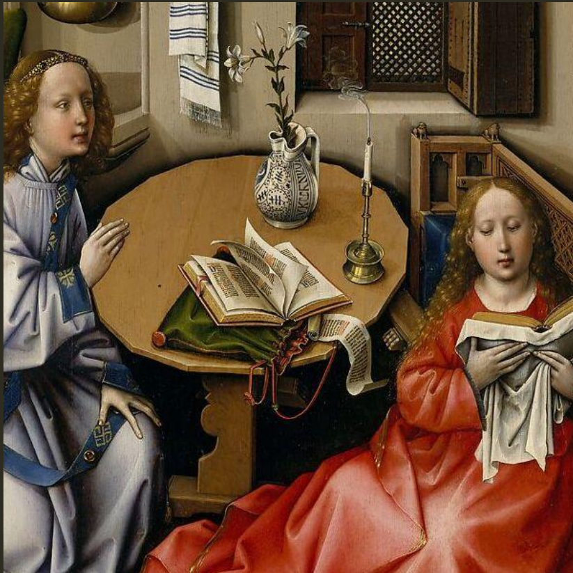
Abb.: Werkstatt Robert Campin: Verkündigungs-Triptychon (Merode-Altar) (1427-1432), Detail