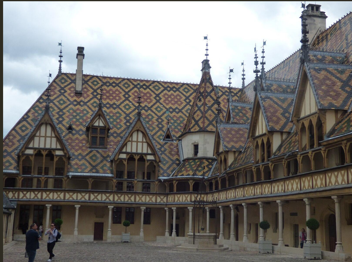
Abb.: Cour d'Honneur des Hôtel-Dieu in Beaune