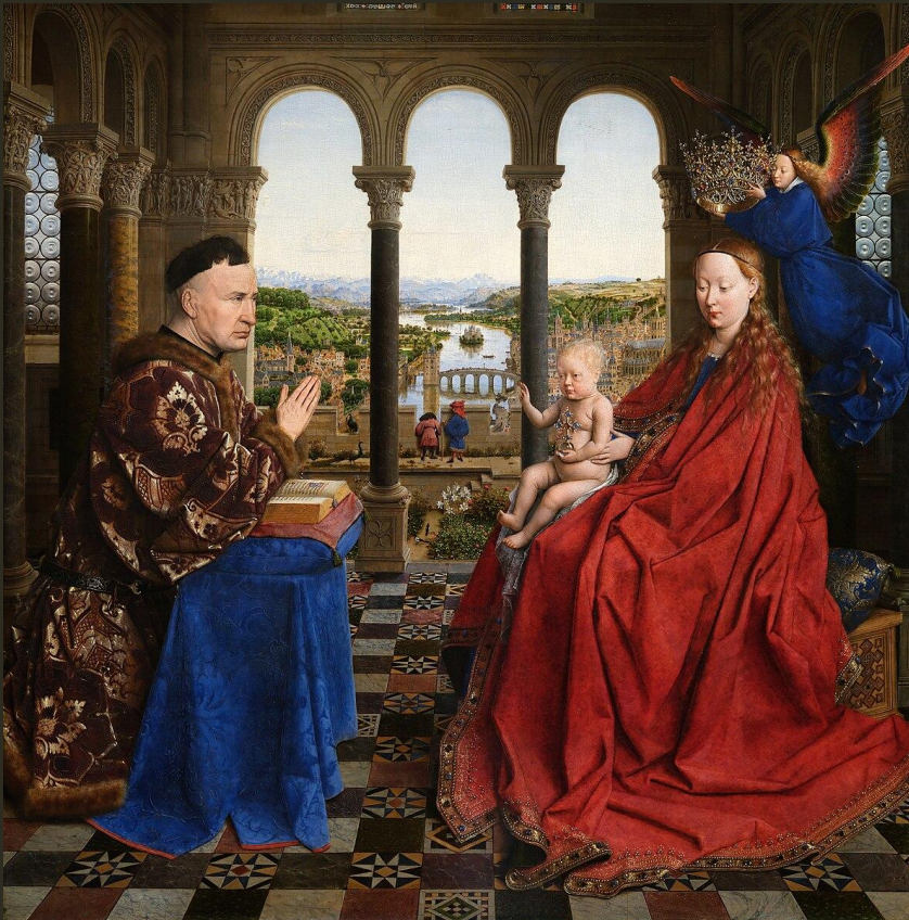
Abb.: Jan van Eyck: La Vierge et l'Enfant au chancelier Rolin (1. Hälfte 15. Jh.)