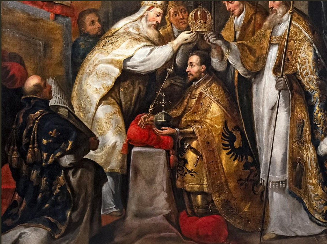
Abb.: Nach Gaspar de Crayer: Couronnement de l'empereur Charles Quint à Bologne (17. Jh.), Detail