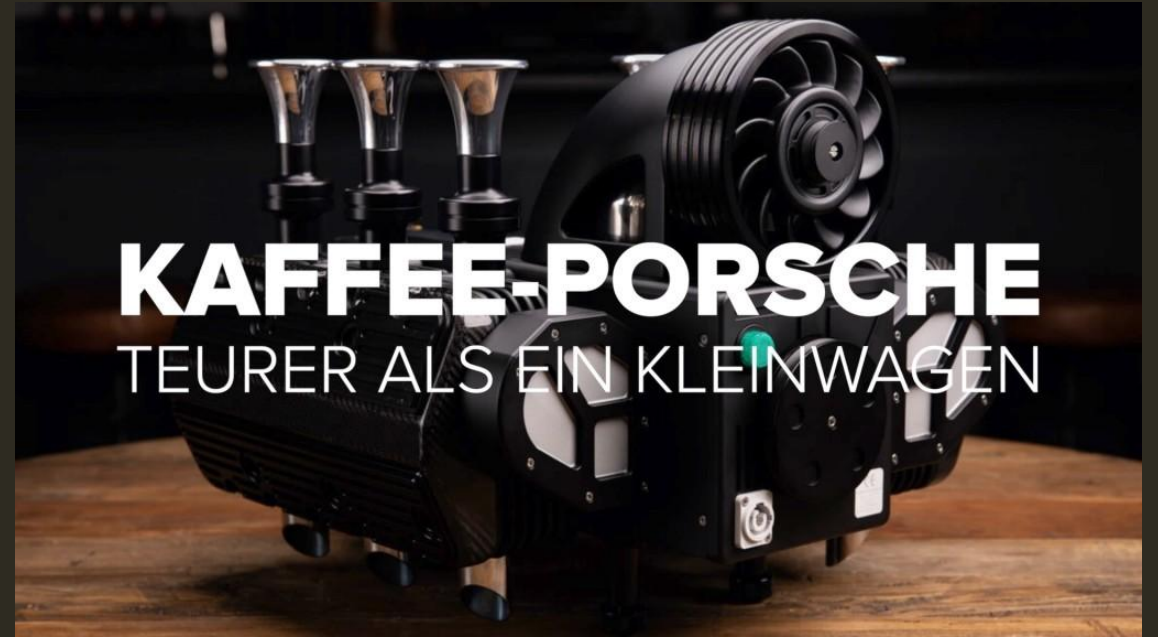
Abb.: RS Black Edition von Espresso Volce