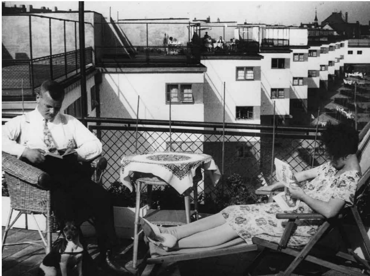
Dach-Terrassen der Wohn-Siedlung in der Bruchfeldstraße